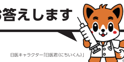
日医キャラクター「日医君(にちいくん)」